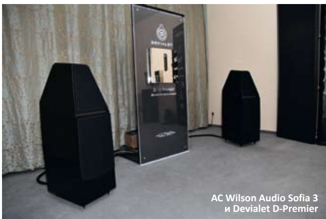
АС Wilson Audio Sofia 3 и Devialet D-Premier

цифровым усилителем». Поскольку Devialet D-Premier оснащен встроенным ЦАП и многочисленными цифровыми входами, а также имеет возможность беспроводного соединения с компьютером, он был на сцене един во всех лицах. Точнее, он был закреплен в вертикальном положении на специальном стенде между колонками, а ничего больше вокруг не наблюдалось. Из-за этого в стандартной комнате отеля «Аквариум» было необычно пусто и просторно по сравнению с другими такими же, но загруженными разнообразной аппаратурой и змеями соединительных кабелей. По сравнению с прошлогодней инсталляцией стало меньше явного и очевидного «блеска породистого хай-энда», совмещенного с живостью звучания, который обычно сопутствует прослушиванию Wilson Audio. Однако акустические системы Sofia 3 прозвучали очень насыщенно, убедительно и гармонично, подтвердив безусловный статус бренда как одного из самых музыкальных. Французский посол прогресса, нашпигованный новыми технологиями под самую крышку корпуса, тоже не сплеховал в этой связке, хотя, по нашему скромному мнению, ведущими были все же АС.