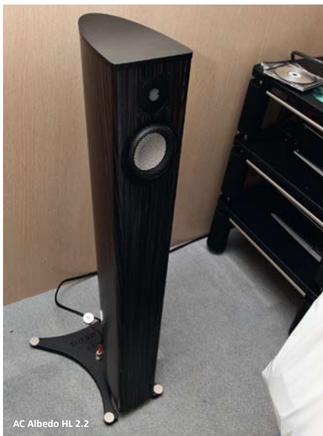
AC Albedo HL 2.2

миссионерской линией акустического оформления и массивными чугунными постаментами, обеспечивающими устойчивость изящным корпусам, которые смотрятся как букеты цветов или вспышки салюта. Индекс HL в названии моделей означает «Helmholine», то есть линия Гельмгольца. А связано такое странное название с тем, что внутри трансмиссионной линии у этих колонок нет привычного специального поглотителя, оптимизированного под определенные частоты (как, допустим, у английских PMC). Для гашения резонансов на некоторых частотах прямо внутри акустического лабиринта установлен набор резонаторов Гельмгольца, что и составляет фирменную изюминку для использованного типа АО. Стоимость необычных красавчиков оказалась весьма гуманной – 210 000 руб.