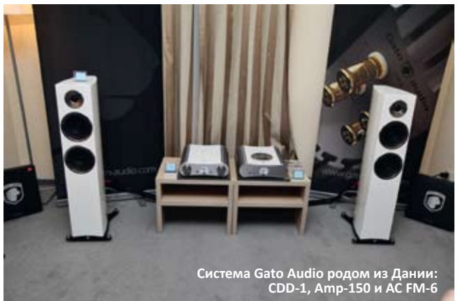
Система Gato Audio родом из Дании: CDD-1, Amp-150 и АС FM-6

Вторым помещением, не пугавшим посетителей громовыми раскатами мощных систем прямо с порога, стала комната АТЕМ HiFi. Впрочем, в этой компании по традиции ценят аккуратный и деликатный звук, рассчитанный не на королевские покои, а на реальные малогабаритные квартиры. И все представленные сетапы, от комплекта с миниатюрными английскими Kudos ровно по пояс взрослому человеку до весьма серьезной по стоимости сборки Gato Audio, отыгрывали именно в таком стиле – точно, аккуратно и в ненавязчивой манере. Из интересных новинок были отмечены изящные итальянские двухполосные мониторы Albedo, с керамическими динамиками, транс-