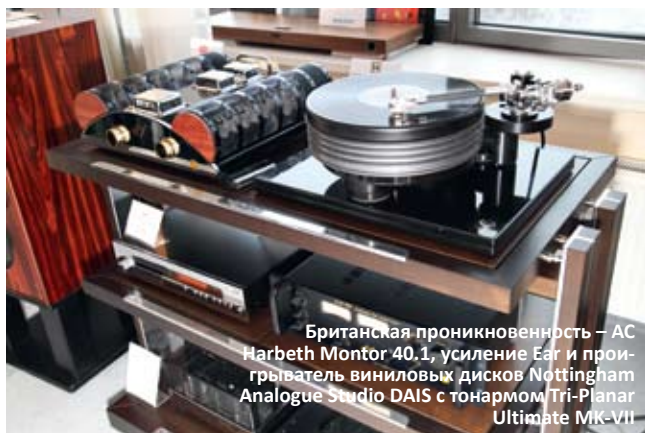
Британская проникновенность – AC Harbeth Montor 40.1, усиление Ear и проигрыватель виниловых дисков Nottingham Analogue Studio DAIS с тонармом Tri-Planar Ultimate MK-VII

На другой стороне комнаты посетители могли увидеть безупречно стильную и весьма эксклюзивную систему с акустикой окружающего звучания Duevel. К сожалению, видеорядом все и ограничилось, послушать знатных немецких гостей не удалось – вечная проблема с площадью демонстрационных комнат в отеле «Аквариум» встала и перед «Техно-М», так что после некоторых размышлений систему, требующую под себя доста-