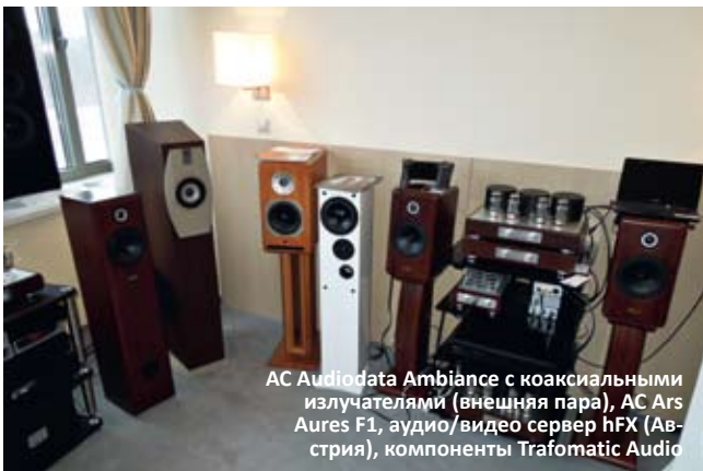
АС Audiodata Ambiance с коаксиальными излучателями (внешняя пара), АС Ars Aures F1, аудио/видео сервер hFX (Ав- стрия), компоненты Trafomatic Audio

Посещение комнаты компании Diatonik доставило приятные эмоции по двум причинам. Во-первых, на небольшой площади («в тесноте, да не в обиде») обнаружили изделия сразу нескольких брендов, достаточно редко встречающихся в России и уж точно не относящихся к поднадоевшему мейнстриму. Во-вторых, эти изделия отличались очень умеренными ценами при весьма перспективной конструкции. С рядом моделей немедленно захотелось познакомиться поближе и проверить их