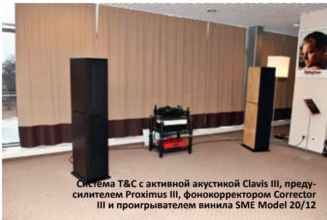
Система T&C с активной акустикой Clavis III, предусилителем Proximus III, фonoкорректорom Corrector III и проигрывателем винила SME Model 20/12