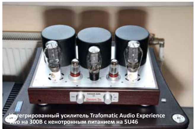
Интегрированный усилитель Trafomatic Audio Experience Two на 300В с кенотронным питанием на 5U46

в тщательном тесте. Например, интересными показались ламповые усилители Trafomatic Audio родом из Сербии. Конструкция интегрированного Experience Two навскидку выглядит удивительно добротной, при его цене в 4000 евро. У небольшой фирмы из родственной славянской страны в каталоге есть и двухблочные конструкции, и усилители для наушников, все исключительно приятно выглядящие и в «экологических» корпусах из хорошо обработанного дерева. Им под стать была и представленная акустика фирм Audes (бывшая «Эстония»; когда-то у автора текста была виниловая вертушка редкой в те времена модели 010), Ars Aures (Италия), французской Jean-Marie Reynaud и немецкой Audiodata – настоящий Евросоюз в миниатюре. Настроение в комнате царило дружелюбное благодаря звукам, издаваемым всеми этими интересными вещами. На выставке всегда есть грандиозные масштабные инсталляции, привлекающие всеобщее внимание. Но такие мероприятия хороши и тем, что попадаются и приятные «островки комфорта и уюта», мимо которых грех пройти и не заглянуть.