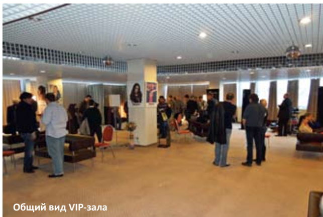
Общий вид VIP-зала

В повторение опыта прошлого года на выставке снова был открыт VIP-зал на шестом этаже отеля «Аквариум», где по кругу было расставлено несколько систем разных дистрибьюторов, включаемых по очереди. Таким образом, имелась возможность буквально в лоб сравнить разные фирменные концепции. Полный круг обходился примерно за час, но многие посетители оставались и на второй заход, чтобы получше расслышать действительно уникальные системы, собранные в зале. С точки зрения акустики помещения большой конференц-зал отеля «Аквариум» не назовешь оптимальным вариантом, однако некоторые из представленных сетапов в принципе могли «поместиться» только туда. Об отдельных инсталляциях мы уже рассказывали выше (в частности, «Пурпурный Легион» с Westlake, а также по одной системе