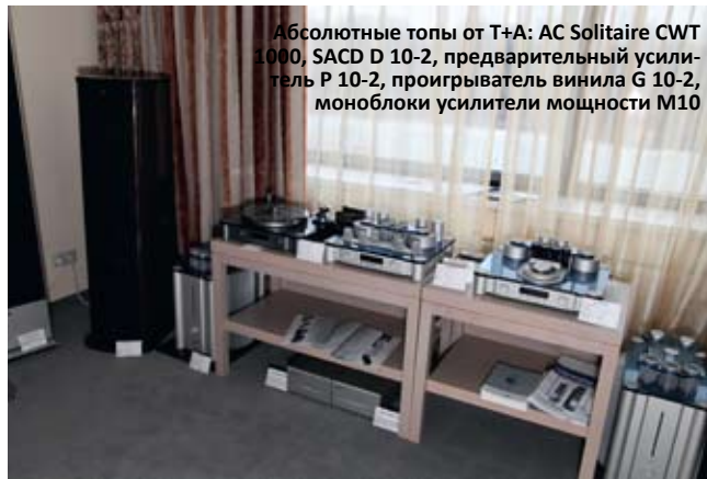
Абсолютные топы от T+A: AC Solitaire CWT 1000, SACD D 10-2, предварительный усилитель P 10-2, проигрыватель винила G 10-2, моноблоки усилителя мощности M10

ный, ассоциирующийся с чистым и холодным горным ручьем. Окружение в виде верхних ламповых компонентов обеспечивает пластичный и детальный саунд всей связки в целом. Из комнаты не хотелось уходить, потому что звук разрушал все стереотипы относительно бренда. Хотя, конечно, разрушение стереотипов – вещь в высшей степени положительная.