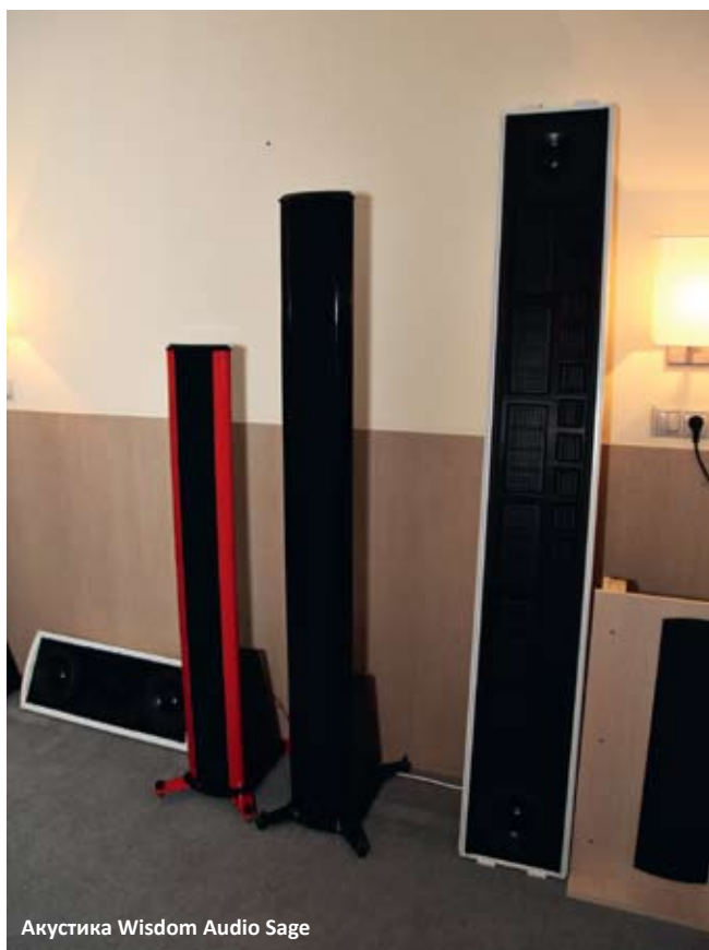
Акустика Wisdom Audio Sage

В трех комнатах компании «Русская Игра» удалось послушать инсталляции с рупорными, электростатическими и «обычными» акустическими системами. Первые были представлены немецкой парой Avantgarde Acoustic Duo Mezzo с двумя драйверами в рупорном оформлении и поддержкой сабвуфера. Сolidные серые рупоры обеспечивали очень вкусную середину, отмеченную многими посетителями, хотя помещение