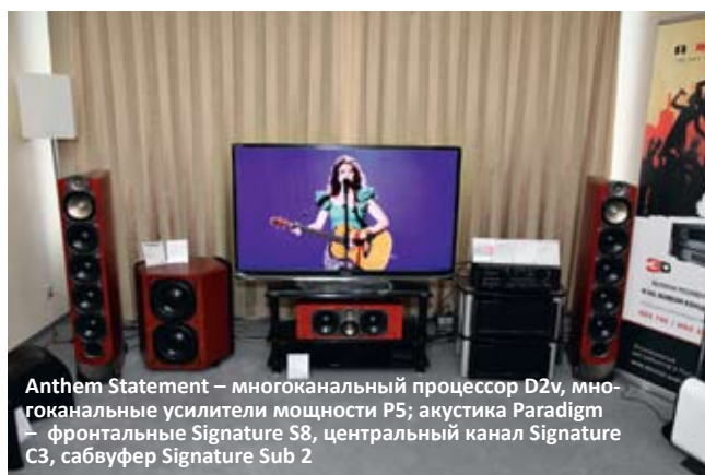
Anthem Statement – многоканальный процессор D2v, многоканальные усилители мощности P5; акустика Paradigm – фронтальные Signature S8, центральный канал Signature C3, сабвуфер Signature Sub 2

В двух комнатах компании «Абсолютное Аудио» по традиции были показаны инсталляции полных стерео- и многоканальной систем McIntosh Laboratory в первой и Paradigm+Anthem во второй. По контрасту удалось отметить гипермоторный, хлесткий и масштабный звук массивов McIntosh на живой записи рок-концерта и отчетливо более округлую и «домаш-