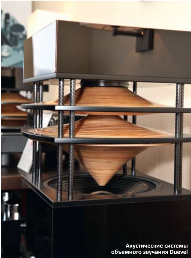
Акустические системы объемного звучания Duevel

точно места и адекватные акустические условия, было решено не включать. А жаль – она выглядела так притягательно, да еще и новинка с говорящим названием «Свет во тьме» (гибридный стереоусилитель Einstein) серьезно стимулировала воображение. Но придется подождать ситуации, когда для этого света будет создана приемлемая безоблачная атмосфера.