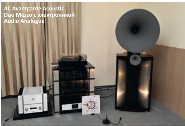
AC Avantgarde Acoustic Duo Mezzo с электроникой Audio Analogue

оказалось явно недостаточным для того, чтобы сформировать полностью однородное звуковое поле от этих масштабных акустических систем. Представители второго конструктивного класса, в виде Martin Logan (младшие в тройке на фото), в компании все тех же Audio Analogue во время нашего визита честно пытались отыграть треки Rammstein. Результат оказался лучше ожидаемого, хотя я все равно позволю себе остаться при мнении, что подобная конструкция излучателей даже с поддержкой сабвуферной секции не позволяет им в полной мере благоволить к энергичным современным жанрам. И, наконец, в третьей комнате обнаружили две системы с компонентами Quad, одна – с немецкой акустикой Phonaq, а вторая – чисто английская, с электроникой Quad Elite и AC также от Quad или Wharfedale. Особенно понравилось последнее сочетание, звучащее вполне адекватно, открыто и чисто – действительно хороший Hi-Fi за умеренные деньги.