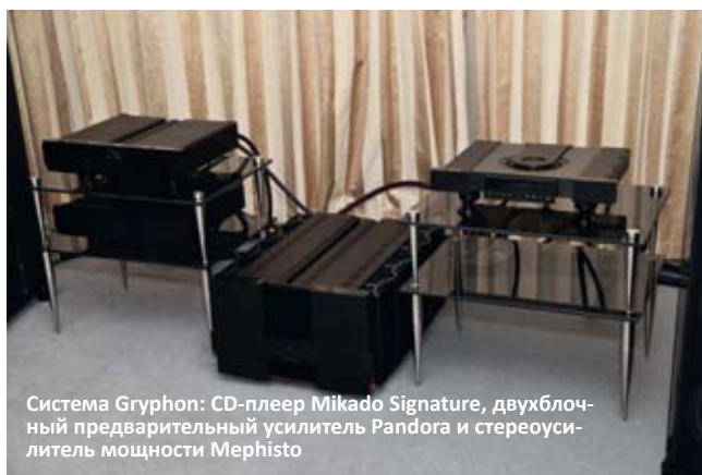
Система Gryphon: CD-плеер Mikado Signature, двухблочный предварительный усилитель Pandora и стереоусилитель мощности Mephisto