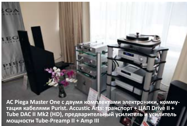
AC Piega Master One с двумя комплектами электроники, коммутация кабелями Purist. Accustic Arts: транспорт + ЦАП Drive II + Tube DAC II Mk2 (HD), предварительный усилитель и усилитель мощности Tube-Preamp II + Amp III

В комнате T-ART ожидаемо обнаружили акустические системы Piega, верхние MasterOne, а также компоненты немецкой фирмы Accustic Arts и итальянской Audia Flight. Позитивным моментом стала возможность переключения пары с одного комплекта на другой, чтобы выделить почерк как самой акустики, так и электронного окружения. Этот стенд стал одним из немногих, столь правильно и концептуально подошедших к проблеме выставочных прослушиваний и оценок. Также запомнился дизайн самой комнаты в нежных серебристо-голубовато-розовых тонах, исключительно гармонично сочетавшийся со звуком системы. Кто сказал, что Hi-Fi – это только звук? Hi-Fi – это во многом еще и образ, и внешний вид (когда мы ведем речь о домашней системе), и попытка подать не просто компоненты и акустику, а создать некий единый аудиовизуальный ряд весьма похвальна. Новинкой на стенде явилась американская виниловая вертушка Spiral Groove SG 1.1 с тонармом Centroid ToneArm.