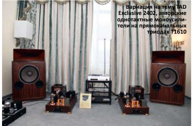
Вариация на тему TAD Exclusive 2402, авторские однотактные моноусилители на прямоканальных триодах T1610

по-прежнему исключительно цепляет и ложится бальзамом на душу, в нем есть и человечность, и духовность (пусть это не звучит смешно в контексте всего лишь аудиосистемы). Сразу хочется самому собрать или заказать что-то подобное, чтобы играло и веселило сердце. Так что добро пожаловать назад в будущее.