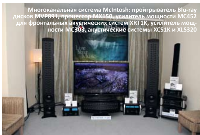
Многоканальная система McIntosh: проигрыватель Blu-ray дисков MIVP891, процессор MX150, усилитель мощности MC452 для фронтальных акустических систем XRT1K, усилитель мощности MC303, акустические системы XCS1K и XLS320

нюю» передачу саунда акустикой Paradigm. Две интересные концепции одинаково заслуживают внимания (конечно, с учетом разного уровня, в том числе и по цене). Помимо прочего, автору неизменно симпатичны «канадские гимны» в исполнении аппаратов, выросших как дочерняя веточка на дереве знаменитого Sonic Frontiers. Процессор Anthem Statement D2v, присутствовавший на выставке, можно охарактеризовать как один из лучших существующих многоканальных процессоров, хотя несколько лет назад фирме можно было поставить в упрек некоторую консервативность. В частности, когда доступные мейнстримовые кинотеатральные процессоры уже вовсю оборудовались разъемами HDMI, поддерживающими новые версии протокола, Anthem не торопилась следовать моде в своей элитной линейке. Однако, по словам дистрибьютора, совсем скоро ожидается обновленная версия с индексом 3D, так что перспективы становятся радужными. Из уже имеющихся новинок отметим новый стереоусилитель McIntosh MC452, являющийся самым мощным из выпускавшихся фирмой.