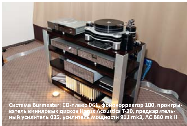
Система Burmester: CD-плеер 061, фонокорректор 100, проигрыватель виниловых дисков Haess Acoustics T-30, предварительный усилитель 035, усилитель мощности 911 mk3, АС B80 mk II

Чрезвычайно удачная система, составленная из топовых компонентов немецкой фирмы Burmester, положительно запомнилась посетителям выставки, насколько можно судить по многочисленным последовавшим обсуждениям и комментариям прямо в зале. Прежде всего, эта инсталляция, пожалуй, была единственной, действительно отыгравшей без особых проблем в акустически довольно сложном зале. При этом комплект не демонстрировал ни единого признака перегрузки, прокачать огромный шумный зал оказалось ей вполне по плечу, как и продемонстрировать впечатляющую цепкость, моторность, прозрачность саунда без грамма резкости даже при очень значительном уровне громкости и полнейшую музыкальную всеядность. Видимо, не случайно номер модели усилителя мощности так красноречиво совпадает с немецкой легендой автомобилестроения от Porsche. Удивительная не критичность акустики к расстановке и уровню подводимой мощности вызвала желание поближе познакомиться с ее конструкцией. К тому же удивило, что ленточный твитер, обычно являющийся слабым звеном по части нагрузки, тут выглядел столь же мускулисто, как и его низкочастотная поддержка. При изучении фирменного каталога никаких экстраординарных новых изобретений не обнаружилось, динамики – действительно классические, без применения камня, ступок плазмы и секретных военных сплавов. Просто это сделано на таком высочайшем уровне технологий, до малейшей детали, что становится произведением искусства, а результаты – налицо. То есть на слуху.