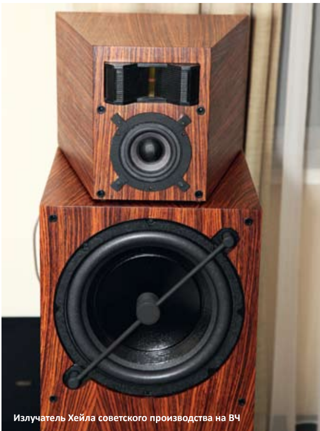
Излучатель Хейла советского производства на ВЧ

Что касается акустики Александра Сырицо, то это тоже в высшей степени примечательная конструкция, просто-таки наполнен-