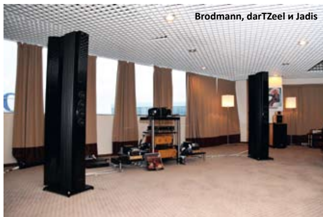
Brodmann, darTZeel и Jadis

В верхнем зале Gong AV поставил свою главную систему, которая, собственно, только и могла быть собранной тут — нигде больше в отеле «Аквариум» не нашлось бы достойной площади адекватного размера. Величественные колонны АС Brodmann JB 205, корпуса которых сконструированы по принципу играющих рояльных дек, поддерживались свитой электронных компонентов двух компаний — darTZeel и Jadis. Это был еще один пример системы с переключаемым усилением для более полного высвечивания разных черт звукового почерка всех участвовавших компонентов. Объемный и даже всеобъемлющий саунд этого «Монблана аудиофилов» окутывал всех слушателей не только в ближнем, но и в дальнем поле густым облаком плотного звучания.